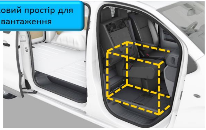
Додатковий простір для довгомірних вантажів